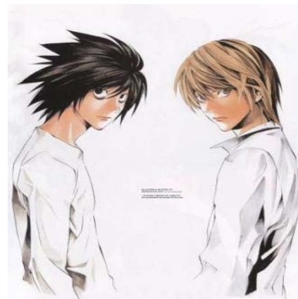
Photo : Illustration japonaise des Mangas

L'art japonais, ambitieux à vouloir fouler le plancher marbré du Roi-Soleil avec l'excès de son modernisme, viole-t-il les honneurs du château ?