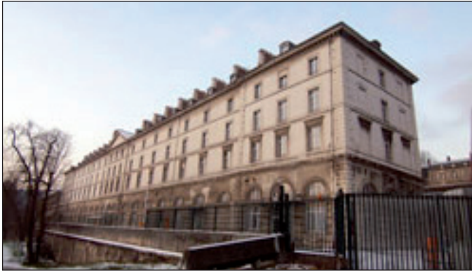
La façade du bâtiment principal, dit "bâtiment Charles X", de la Caserne Sully, vue du Pont de Saint-Cloud (vente par l'État en cours).