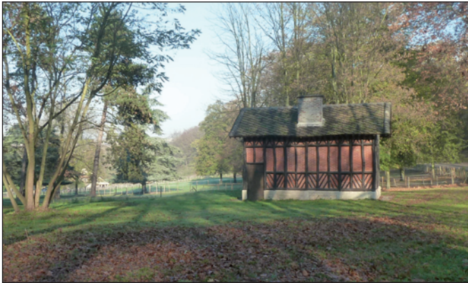
Porte de Garches : le chalet Charles X, plaine de Combleval, désormais en zone UL, constructible !